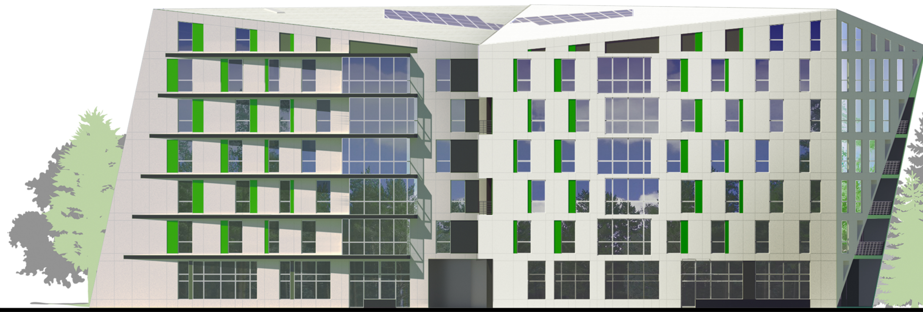
Фасад в осях 1-10 M1:200