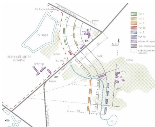
Рис. 3. Схема планировочной структуры жилого комплекса

Все дома представляют собой прямоугольные в плане трехэтажные объемы с чердаком, подвалом и плоской крышей. Чердаки в домах были оборудованы для сушки белья и размещения технических помещений в центральной части. В подвалах были автономные котельные на угле, прочие технические помещения, убежища гражданской обороны (газоубежища) и погреба для жильцов. Дома не имеют балконов и лоджий, квартиры со сквозным или угловым проветриванием (кроме однокомнатных). Во всех помещениях квартир устроена вентиляция. Дома, как правило, двухсекционные (трехсекционные типа 3). Площадь квартир от 29 м 2 до 110 м 2 .