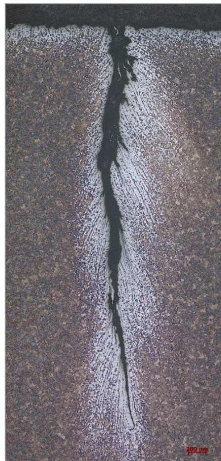
Рис. 3. Микроструктура шлифа, вырезанного в области дефекта