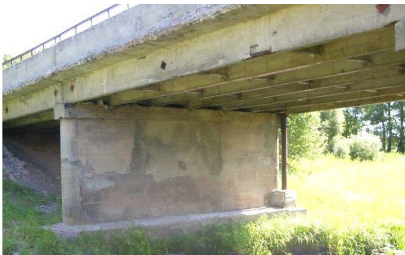
Рисунок 1 – Общий вид моста до реконструкции.