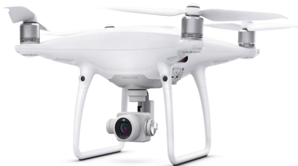
Рис.3. Фото модели БПЛА, используемого СМТ №8