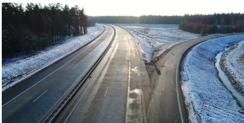
Рис.2. Фото с участка М-3 Минск-Витебск км. 57.3 — км. 65.6 (обход г. Пleshни-цы)