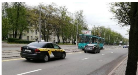
Рисунок 1 – Конфликтная ситуация

Предлагаю решение этой проблемы с помощью видеофиксации процесса посадки-высадки пассажиров с момента включения аварийной сигнализации водителем трамвая и до начала движения трамвая. Если кто-то из пешеходов или пассажиров трамвая становится свидетелем нарушения правил проезда автомобилем останавливающегося трамвая, то с помощью приложения «Безопасный трамвай» данное видео передается органам ГАИ для наказания нарушителя.