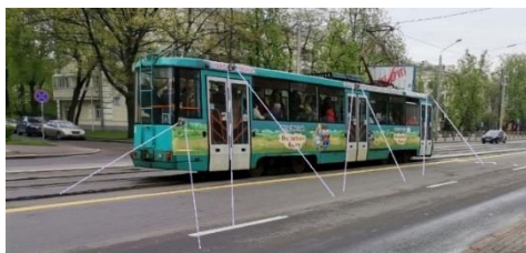
Рисунок 2 – Оснащение трамвая системой «Безопасный трамвай»

Расположение камер на трамвае представлено на рисунке 2.