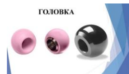
Рисунок 2 – Головка эндопротеза тазобедренного сустава

На этапе 1 планирования СИ на основании исходных данных нами была сформирована система ограничений и концепция системы, которая представляет собой совокупность ключевых параметров и требований, которые необходимо учесть на этапе планирования системы измерений. Данные ограничения касательно рассматриваемой системы измерений шероховатости головки эндопротеза: измерение параметра шероховатости с заданной точностью, измерение шероховатости по сфере, минимизация трудозатрат, мобильность средства измерения, возможность сохранения результатов измерения в автоматическом режиме (электронный или бумажный вариант).