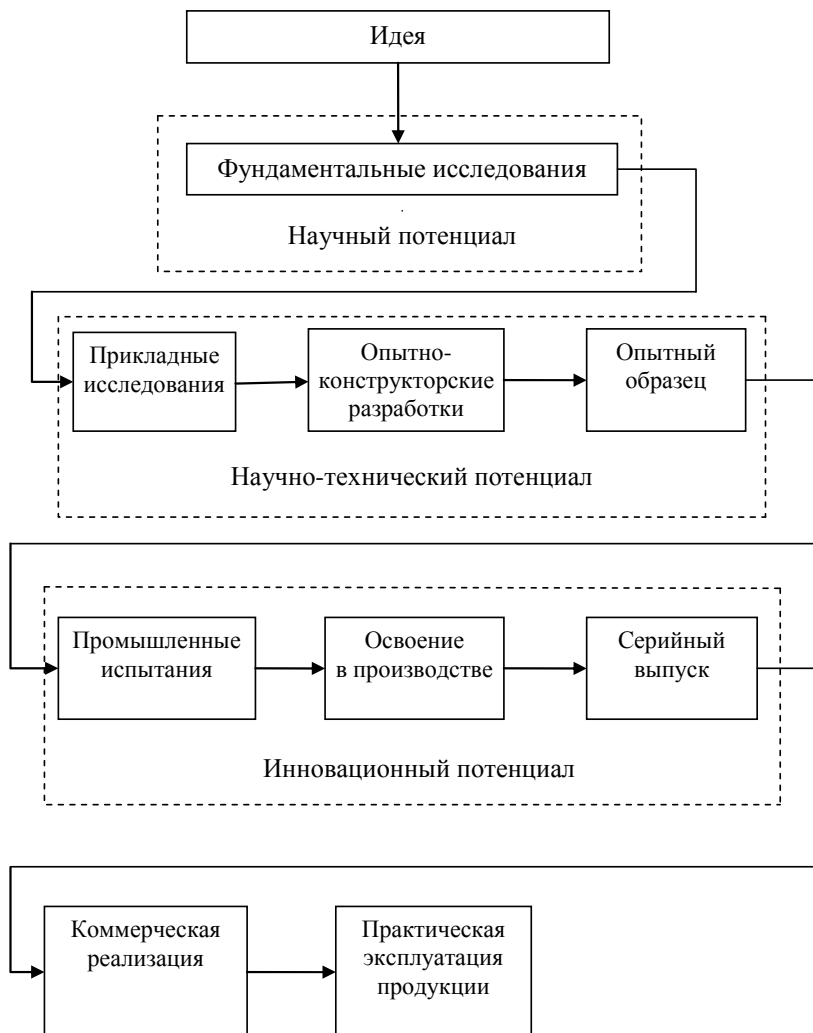
Рис. 2.2. Научно-инновационный цикл