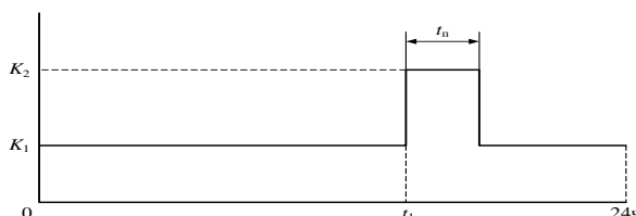
Рис. 2 - Эквивалентный двухступенчатый график нагрузки

На точность определения допустимой перегрузки может повлиять неучет фактического теплового состояния трансформатора в момент времени t_1 , предшествующий началу перегрузки (рисунок 2). Неучет предыстории нагрузки на интервале времени, предшествующем перегрузке, может снизить точность определения длительности перегрузки t_{II} .