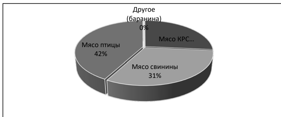
Рисунок 2 – Структура производства мяса в Республике Беларусь в 2020 г.

Экспортирует Россия в Китай (мясо птицы и крупнорогатого скота), Вьетнам, Украину, Гонконг и Беларусь. Снижение импорта обусловлено, с одной стороны, экономическими санкциями против России и экономическими барьерами для иностранных производителей, а с другой – необходимостью развития сельского хозяйства для импортозамещения и субсидированием российских производителей. Лидером среди экспортеров мясной продукции является Беларусь. Производство на душу населения в натуральном выражении за последние 5 лет увеличилось со 124 до 137 кг, при этом потребление возросло в меньшей степени с 92 кг в 2016 до 97 кг в 2020 году. Беларусь наращивает объемы производства и экспорт мясной продукции. Наибольший объем экспорта приходится на Россию (65,2%), вторым по объему экспорта является Китай (13,9%), 11,8 % белорусского экспорта приходится на Казахстан. Так же Беларусь экспортирует продукцию в Узбекистан, Украину, Кыргызстан, Азербайджан, Армению, Молдову, Гонконг, Гану, Вьетнам, Грузию, Таджикистан, Таиланд, Экваториальную Гвинею, Иорданию и Сингапур. Структура произведенного мяса в Республике Беларусь имеет следующий вид (рисунок 2).