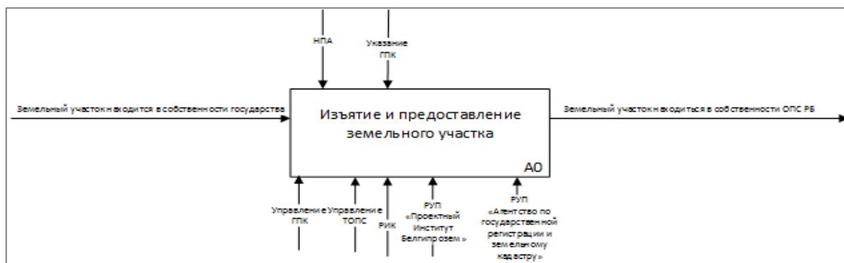
Рисунок 1 – Контекстная диаграмма процесса изъятия земельного участка и предоставление его органам пограничной службы

изъятия земельных участков для строительства инженерной инфраструктуры Государственной границы должностными различными территориальными органами пограничной службы разработан детальный алгоритм действий должностных лиц управления территориального пограничной службы, контекстная диаграмма и диаграмма декомпозиции [3] которого приведены на рисунках 1 и 2 соответственно.