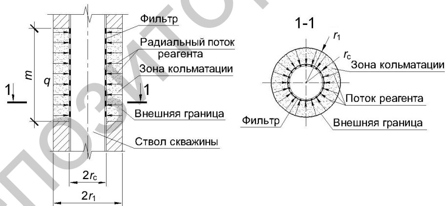
Рис. 1. Расчетная схема затрубной реагентной промывки гравийной обсыпки скважины

Схематизируем закольматированный грунт гравийной обсыпки в виде пористого кольцевого цилиндра с наружным радиусом r_1 и высотой m , равной длине фильтра совершенной по степени вскрытия пласта скважины. Внутренний радиус цилиндра равен радиусу скважины r_c . Расчетная схема реагентной промывки гравийной обсыпки представлена на рис. 1.