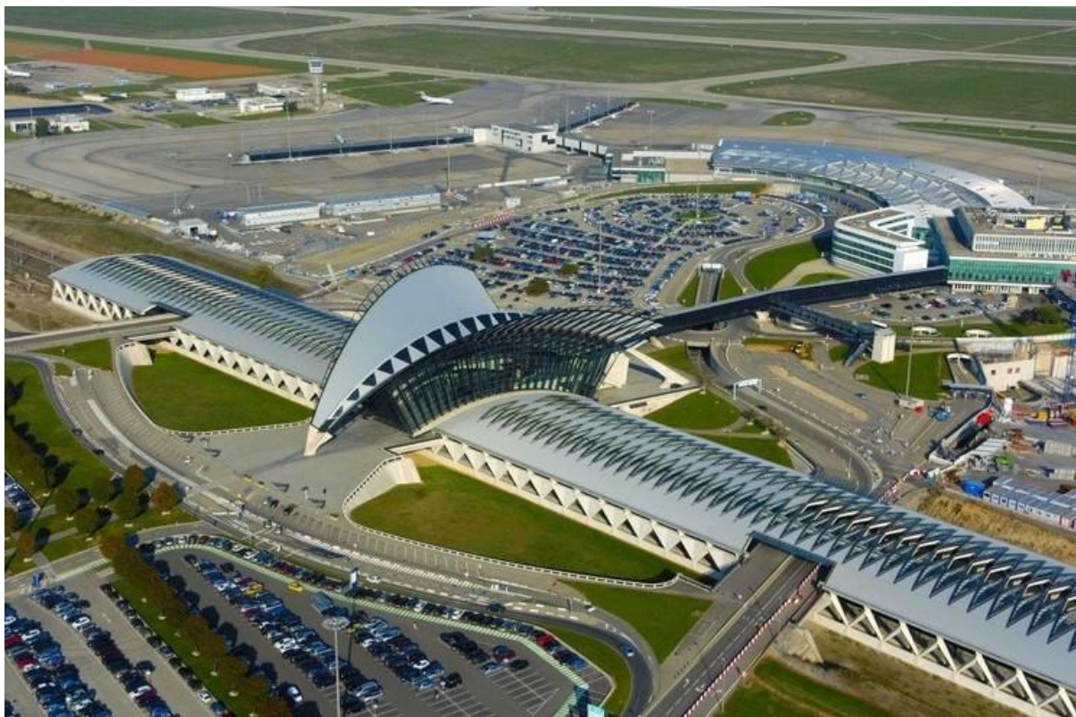
Рисунок 2 – Внешний вид

аэропорт Лиона. Открытие было проведено президентом Валери Жискард д'Эстеном 12 апреля 1975 года и открыто для пассажиров через неделю после открытия. Старый аэропорт Лион-Брон был заменен новым аэропортом Лиона. Причина замены в том, что старый аэропорт нельзя было расширить. В 1994 году в Лион была проложена высокоскоростная железнодорожная ветка, которая обеспечивает прямые поезда в Марсель и Париж.