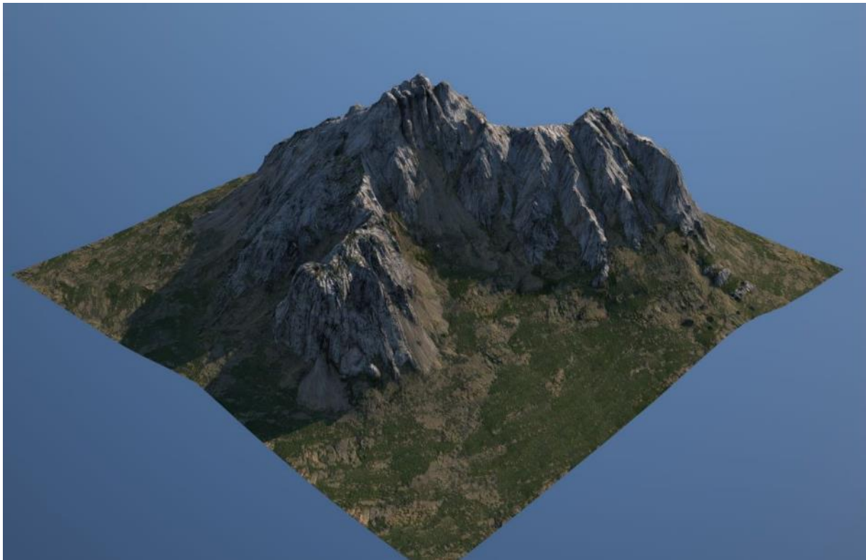
Рисунок – 2 Модель горной поверхности