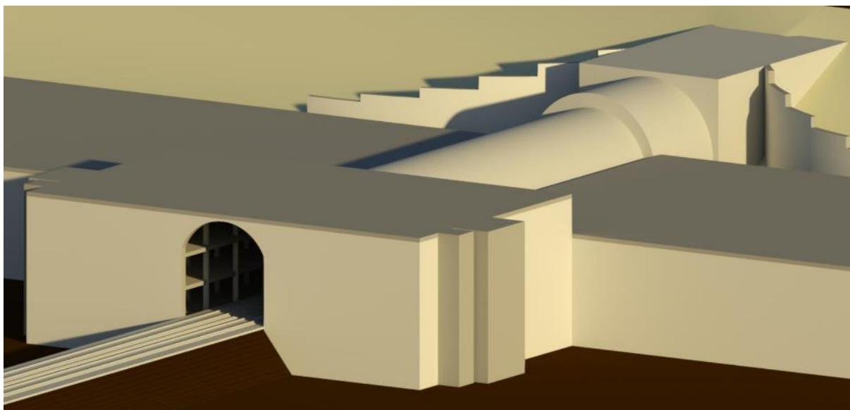
Рисунок 4 – Промежуточная визуализация портала