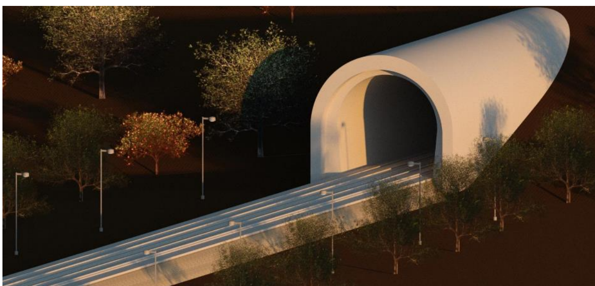
Рисунок 5 – Промежуточная визуализация туннеля

Железнодорожный тоннель спроектирован в один ярус, для возможности передвижения поездов. Длина тоннеля составляет 49 км. Тоннель разработан по современным нормам: обязательное отопление, вентиляция, освещение, водоотводные устройства. С помощью спутниковых систем получены отметки дневной поверхности и построен продольный профиль (Рис. 3). Пространственная модель портала и тоннеля сделана в программном комплексе Revit (Рис. 4-5). Материалы при строительстве должны отвечать требованиям долговечности, прочности, морозостойкости, стойкости против агрессивных воздействий внешней и внутренней среды, несгораемости.