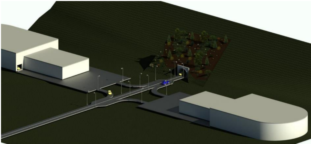
Рисунок 3 – Модель портала