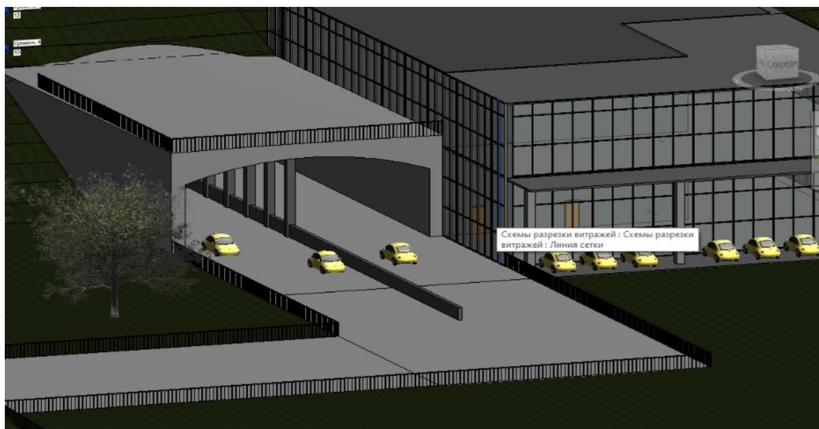
Рисунок 3 – Портал тоннеля

В связи с резким перепадом высот от нулевого до второго пикета, запроектировано защитное сооружение от обвалов и оползней.