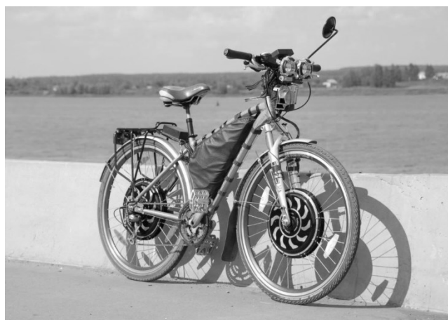
Рисунок 1 – Мотор-колесо на велосипеде

В наше время область применения мотор колёс на транспортных средствах различного класса сильно расширяется. Это связано с тем, что использование мотор колёс позволяет создавать машины новой конструкции, у которых отсутствует трансмиссия. Они нашли своё место в общественном транспорте, электровелосипедах, электроприводах, инвалидных колясках и т.д.