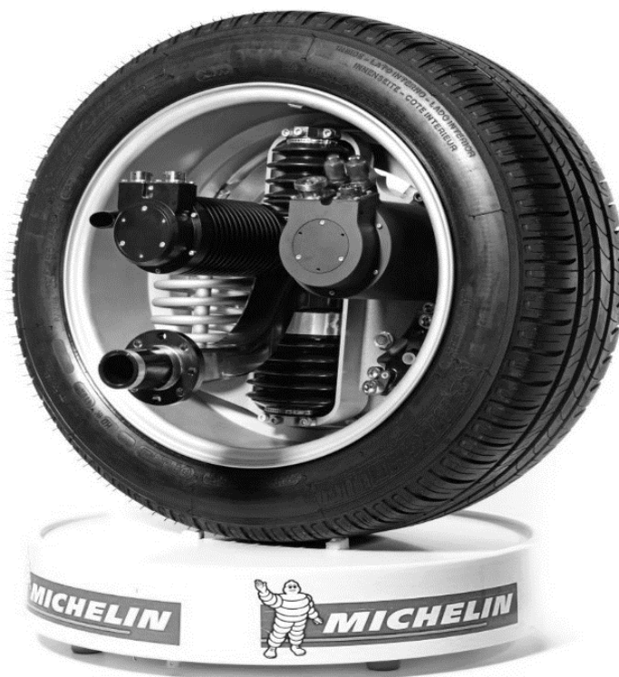
Рисунок 3 – Мотор-колесо с системой Active wheel

К недостаткам такого колеса можно отнести то, что у него более сложный редуктор, который увеличивает затраты на его производство и ремонт, большое количество элементов редуктора которые несколько снижают эффективность и надёжность колеса.