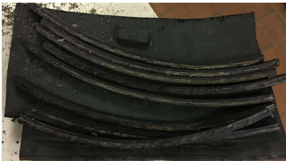
Рисунок 1 – Нарезанные части отработанной конвейерной ленты с ОАО «МТЗ»

Представляет большой интерес перенести опыт переработки резинотехнических изделий, на отходы, образующиеся на Белорусских предприятиях. В качестве представителя отходов резинотехнических изделий использовались куски отработанных резинотканевых конвейерных лент скапливающихся на ОАО «МТЗ» (рисунок 1).