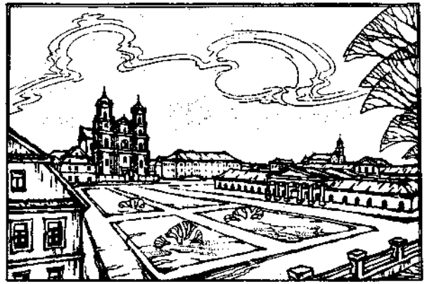
Рис. 3. Гродно. Торговая площадь. Начало XIX века

лишь на желание восстановить историческую справедливость. Он является широкой градостроительной задачей, поскольку одним из существенных критериев по-прежнему является положение сооружения в городской структуре, тот архитектурно-пространственный эффект,