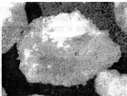
Рис. 1. Частица смеси на основе природного кварца фракции (+315)...(-630) мкм

Критериями оценки смешиваемости компонентов смеси являются: равномерность перемешивания и качество плакирования частиц связующими добавками (определяется с помощью микроскопического исследования (рис. 1)), комкование смеси.