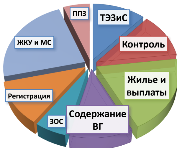
Рисунок 1 – Ориентировочные доли задач КЭС

Чтобы понять важность рассматриваемой темы, необходимо ознакомиться с задачами КЭС во внутренних войсках: