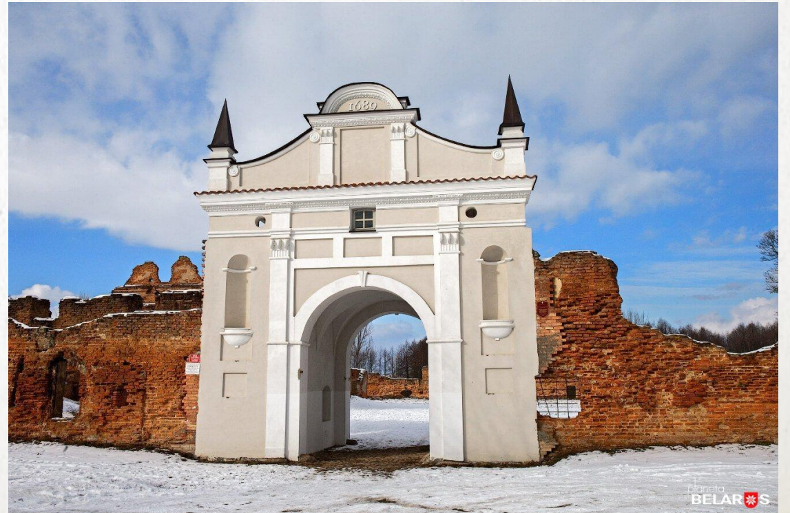
Главный вход после реконструкции