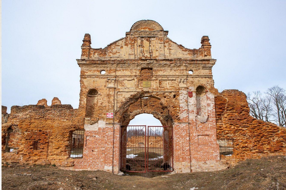
Главный вход до реконструкции