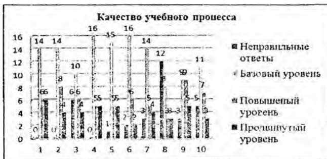
Рисунок2. Статистическая модель качества учебного процесса

Расчёт параметров статистической модели позволяет перейти от элементарных графиков (рис. 1) к визуализации характеристик качества учебного процесса с последующей формулировкой управляющих воздействий (рис. 2).