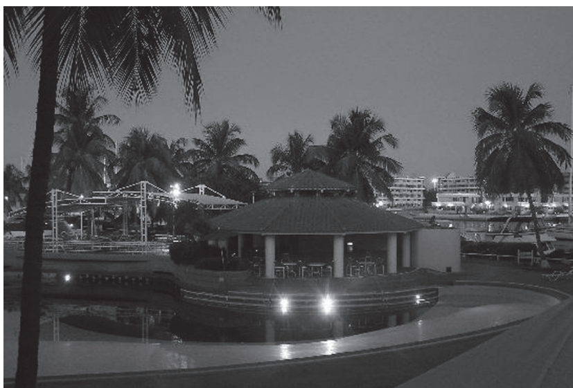
Гостиница, г. Маремарес

куры, начинают периодически подавать голос, т. е. как и в нашей родной Беларуси с полчетвертого ночи. После шести утра солнце набирает силу, и жара вновь дает о себе знать. Если посмотреть по карте на страну с востока на запад, то после моря видны небольшие горы, затем равнина с реками, озерами, болотами, лесами, которая упирается в громаднейший горный массив (максимальная высота чуть более 5000 м). Снега здесь практически не бывает, если только в горных районах он изредка встречается. Дневная температура воздуха