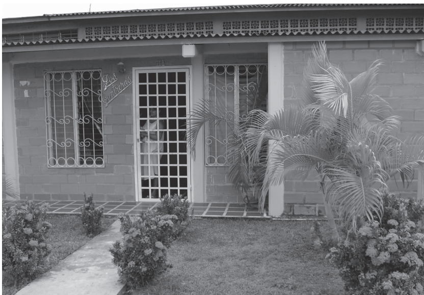
Вход в гостиницу, пригород Анако

мянутые продавцы каким-то образом находят общий язык и конфликтов, как правило, не бывает. Разговаривая с местным таксистом, он отметил, что людям нужно дать заработать, главное — что бы слишком друг-другу не создавали никаких помех. Это один из примеров проявления толерантности. Ведь среди продавцов, водителей и представителей власти (полицейских) есть люди разной расы, национальности и гражданства, достатка, но они друг друга понимают.