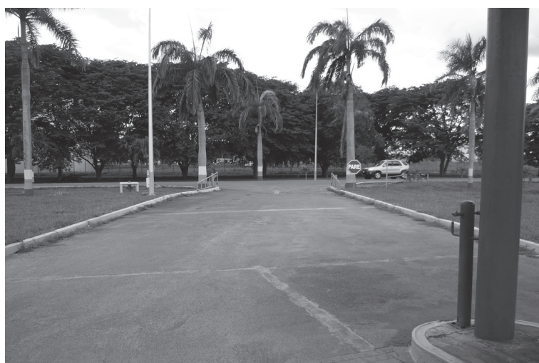
Выезд из заправочной станции