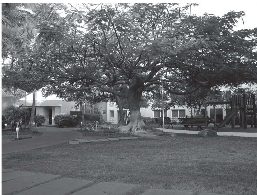
Двор гостиницы, 500-летнее дерево, г. Маремарес

в среднем достигает +35 - +45^{\circ}\text{C} и выше (в тени), а ночная — не ниже +20 - +25^{\circ}\text{C} . И так в течение всего календарного года. Но когда наступает сезон дождей (конец мая — начало сентября), то температура немного снижается, а природа оживает — все бурно растет: и трава, и кустарник, и цветы, и деревья. Флора имеет ярко насыщенный цвет, зарождаются плоды. Люди ждут этого периода с нетерпением. Тропический дождь, как правило, чаще проходит во второй половине дня, но очень интенсивно, т. е. фактически это ливень от полчаса до двух часов.