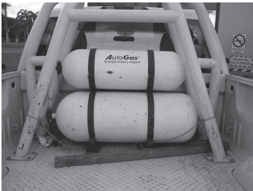
Установка баллонов СПГ на минигрузовике

Наиболее распространенным и востребованным транспортом в этой стране является автомобиль. Нередко это небольшой грузовичок с кабиной от двух до шести мест и кузовом грузоподъемностью до полутора тонн. Много джипов и седанов. Преобладают такие марки, как «Шевроле», «Форд», а из европейских — «Фиат», «Рено», «Фольксваген», «Мерседес-Бенц». Встречаются российские «ВАЗы» — «шестерки», «семерки», «девятки», «нивы». Из азиатских автомобилей можно встретить «Тойота», «Ниссан», «Хонда». На улице города Анако — это север страны —