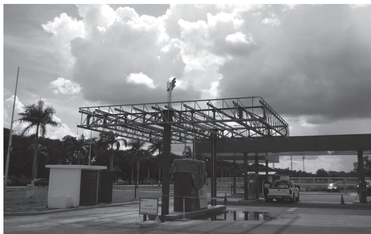
Комбинированная заправочная станция (бензин – природный газ)