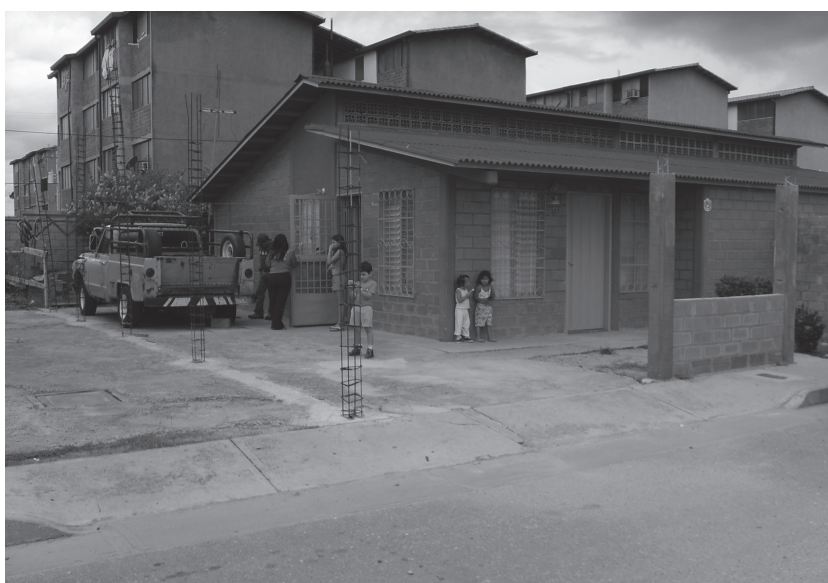
Жилой р-н, г. Анако

колесах можно встретить и в жилых кварталах, и возле автобусных остановок, и возле учебных заведений — школ и университетов, и у обочин автомобильных дорог. Особенно их много возле магазинов и торговых центров, но потребителей это устраивает, а местные власти не чинят никаких препятствий владельцам таких пунктов «быстрого питания». По утрам на проезжей части либо перед перекрестками, а кое-где перед светофорами или «лежащими полицейскими» можно встретить продавцов, предлагающих кофе, сэндвич, свежую газету, мелкие безделушки и другие «тысячи мелочей». Водители, дорожная полиция, и вышеупо-