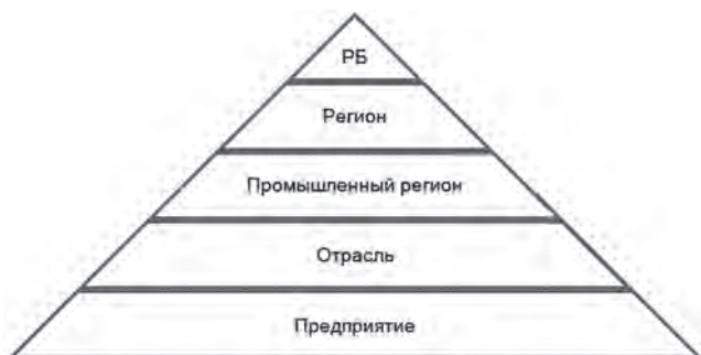
Рис. 1. Система взаимодействия уровней устойчивого развития

Хорошо известно, что от предприятия как структурной единицы экономики в значительной мере зависит эффективность государства в целом. Для экономики гораздо важнее судьба предприя-