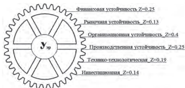
Рис. 3. Структура интегрального показателя экономической устойчивости

Это один из инструментов управления хозяйственной деятельностью, дающий полное комплексное представление о финансово-экономическом состоянии предприятия, организационной эффективности, применении современного оборудования и технологий, использовании рыночной