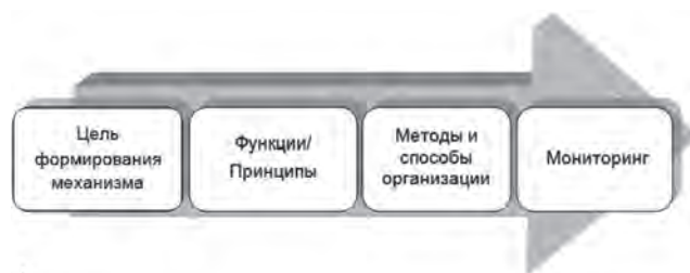
Рис. 2. Алгоритм формирования устойчивого развития предприятия

• возможности достижения предприятием устойчивого развития (рост объемов производства продукции, реализация инвестиционного и научно-технического потенциала, устойчивости в фи-