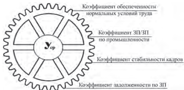
Рис. 4. Структура интегрального показателя социальной устойчивости

Высокое значение и поступательный рост коэффициента инвестиционной активности свидетельствуют об эффективной проводимой стратегии развития завода и достаточном контроле собственников за деятельностью менеджмента.