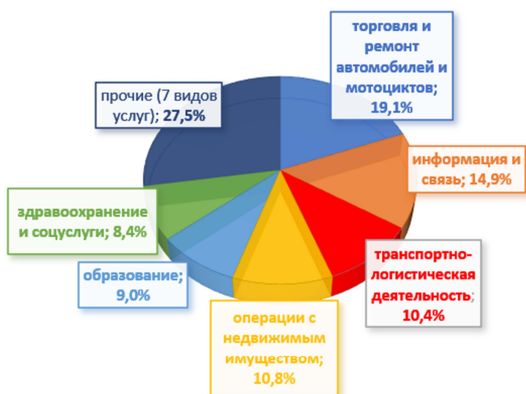
Рисунок 1 – Удельный вес ТЛД в ВВП сферы услуг (собственный анализ по материалам Белстат)

Номинальная начисленная среднемесячная заработная плата работников транспортной отрасли составила в 2020 году 1198,2 руб., увеличившись относительно 2019 года на 13,6 %. Средняя зарплата работников транспортно-логистической деятельности в 2020 году составила 95,8 % к республиканскому уровню заработной платы (рисунок 2).