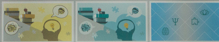
кафедра психологии профессионального образования