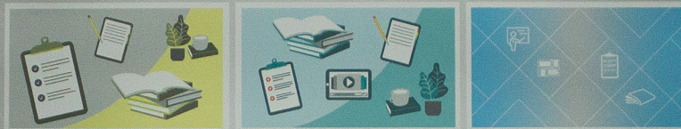
кафедра общей и профессиональной педагогики