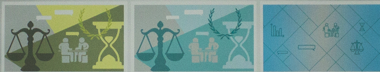
кафедра менеджмента и социально-философских дисциплин