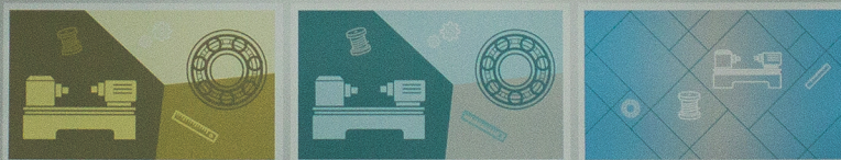
кафедра технологий профессионального образования