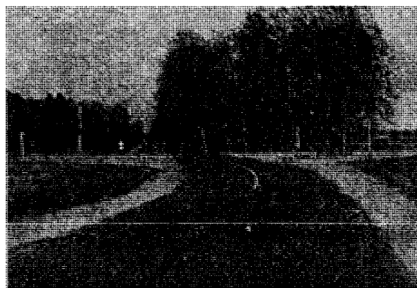
Рис. 3. План трассы капитального ремонта автомобильной дороги предусматривает вписать в угол поворота радиус кривой 2000 м, а фактически оставлен план трассы существующей дороги, имеющей S-образную кривую с радиусами по 60 м