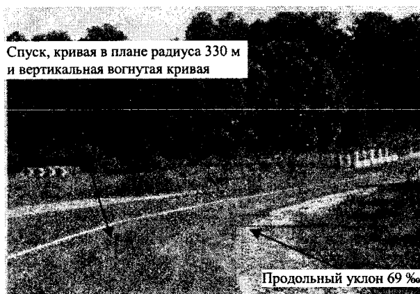
Рис. 4. Вид закругления радиуса 330 м на дороге в месте ДТП, а в техническом паспорте дороги указан радиус 1056 м, продольный уклон фактически равен 69 %, а в техническом паспорте указан 4 %

• параметры плана и профиля на участке дороги в месте ДТП существенно отличаются от указанных в техническом паспорте дороги (рис. 4).