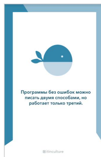
Рисунок 2 – Основа палитры фирменного стиля неформального студенческого сообщества кафедры ИТК БГУКИ

На кафедры информационных технологий в культуре (ИТК) Белорусского государственного университета культуры и искусств (БГУКИ) тенденция к созданию фирменного