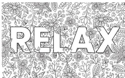
Рис. 2 – Рисунок в брендинге

Этот тренд активно использовался в 2021–2022 годах, хотя ближе ко второй половине уже и пошел на спад, сутью данного тренда являются плоские «флет» иллюстрации, используемые в брендинге. Что отражает близость бренда с обычными пользователями, а так же высокий профессионализм дизайнера внедрившего их в основной стиль бренда.