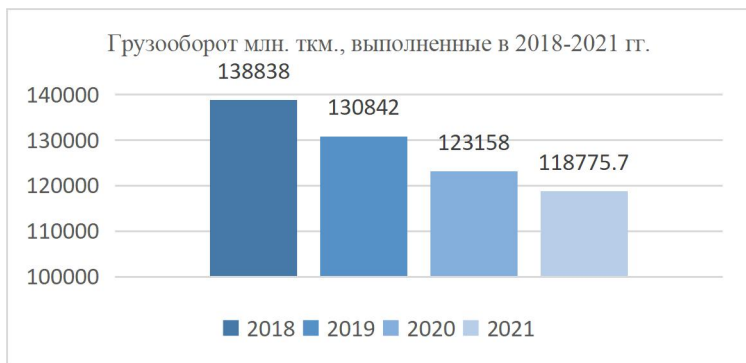
Рисунок 1 – Грузооборот на различных видах транспорта в период 2018-2021 год

В 2021 году объем транспортно-экспедиционных и логистических услуг составил более 3,38 млрд долларов США. Объем транспортно-экспедиционных услуг, всего, составил около 3,11 млрд. долларов США (прирост к показателю 2020 года 34%). Сравнительно соотношение объемов транспортно-экспедиционных услуг за 2019 – 2021 годы представлено на рисунке 2.