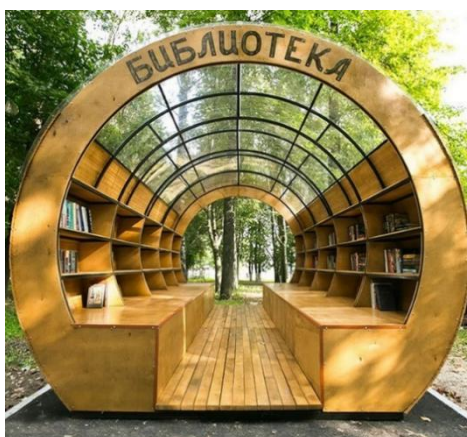
Рис. 4. Павильон буккросинга производства «Стандарт КТ»

Кроме того, малые архитектурные формы могут выполнять широкий спектр задач и нести не только декоративные и утилитарные функции. Так, предлагаемый российским предприятием «Стандарт КТ» вариант площадки для буккросинга (Рис. 4) позволяет дополнительно решать современные социальные вопросы. При этом выбор древесины, в качестве основного материала, для данного объекта, является удачным с различных точек зрения. Формируется прямая отсылка к единству формы и содержания (древесина является исходным материалом для создания книг). Этому соответствует и форма павильона, в виде ствола дерева. Притом деревянные элементы для размещения посетителей создают ощущение уюта и формируют более приятные тактильные ощущения чем металлические или бетонные, что с большей вероятностью заставит человека задержаться внутри данного сооружения.