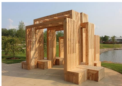
Рис. 3. Городская от производства производственного комплекса «BELVEDERE»

Кроме того, малые архитектурные формы могут выполнять широкий спектр задач и нести не только декоративные и утилитарные функции. Так, предлагаемый российским предприятием «Стандарт КТ» вариант площадки для буккросинга (Рис. 4) позволяет дополнительно решать современные социальные вопросы. При этом выбор древесины, в качестве основного материала, для данного объекта, является удачным с различных точек зрения. Формируется прямая отсылка к единству формы и содержания (древесина является исходным материалом для создания книг). Этому соответствует и форма павильона, в виде ствола дерева. Притом деревянные элементы для размещения посетителей создают ощущение уюта и формируют более приятные тактильные ощущения чем металлические или бетонные, что с большей вероятностью заставит человека задержаться внутри данного сооружения.