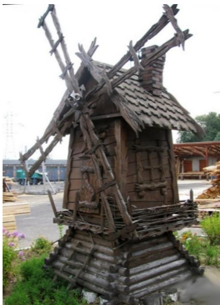
Рис. 1. Малая архитектурная форма производства ОАО «Борисовдрев»

применяемых конструктивных элементов (схожая конструкция основных и вспомогательных объектов), так и с использованием для декора отходов основного производства. Следующим фактором является лёгкость передачи местных архитектурных, традиционных и этнических особенностей соответствующего региона посредством характерных приемов обработки конструкций (древесина была основным традиционным материалов на территории Беларуси на протяжении всей истории). Примером таких элементов благоустройства может служить малая архитектурная форма в виде мельницы [1] производства ОАО «Борисовдрев» (Рис. 1).