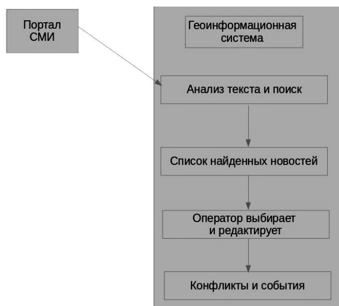
Рисунок 4 – Этапы обработки собранной информации

На следующем этапе стоит разработка инструментария для получения подробных данных о конфликтах. На этом этапе система не только будет рекомендовать новости и предоставлять информацию об участвующих в конфликте лицах или организациях, но также и о том, когда произошло событие, повлекшее резонанс и какие были последствия, если они могли быть в зависимости от произошедшего события.