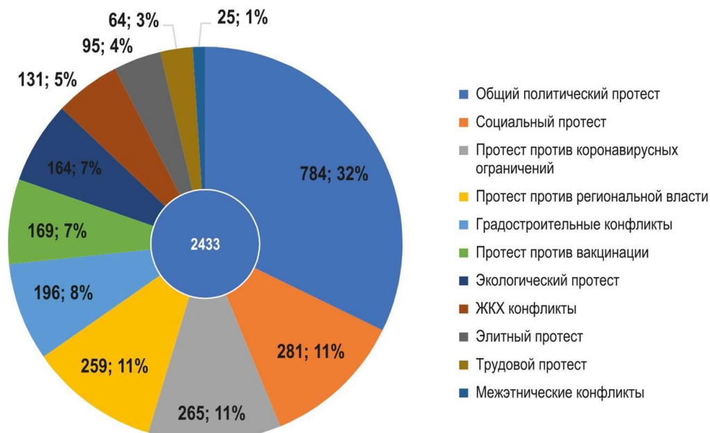
Рисунок 3 – Диаграмма категорий протестных акций за 2021 год [3]

ресурсы могут быть направлены на развитие исследовательских инструментов базы данных конфликта и прочие виды работ, необходимые для более глубокого исследования городских конфликтов.