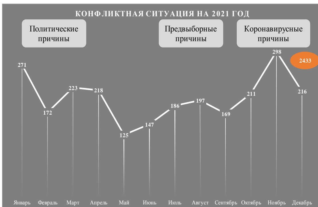
Рисунок 1 – Конфликтная ситуация на 2021 год