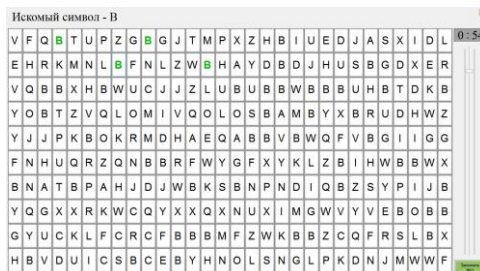
Рисунок 2 - Буквенная таблица Анфимова (тест №2)