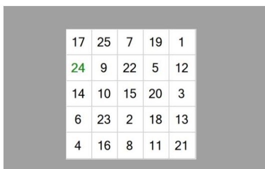
Рисунок 4 - Таблица Шульте (тест №4)

Результаты предварительных экспериментов сведены в таблицу 1