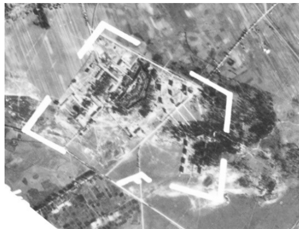
Рис. 3. Аэрофотосъемка Люфтваффе: Траугуттово ок. Бреста-над-Бугом, 1939 г. Направление севера соответствует топографическому

Жилой комплекс поселка разделен на две части главной улицей (сейчас Жукова) и лесопарковой зоной. Верхняя (северная часть) отводилась для размещения домов высшего командного состава, военных чиновников и офицерского состава Центра – так называемая колония офицерская. Нижняя – для прочих сотрудников Центра (подофицеров, рядовых, технического персонала) – колония подофицерская.