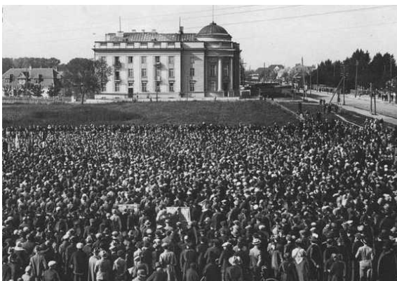
Рис. 7. Брест-над-Бугом. 1930 год. Митинг в районе нынешней площади Ленина [8]

В планировке Бреста выделено два пространства, имеющего статус площади. Это площади Ленина (рис. 7) и Свободы. Существуют еще некоторые общественно значимые пространства: вокзальная площадь около железнодорожного вокзала и около автовокзала), пространства около городского рынка, перед кинотеатрами («Беларусь», «Мир», пересечение улиц Гоголя и Советской (около памятника Тысячелетия Бреста), перед Брестским областным театром драмы, перед крупными магазинами, промышленными предприятиями.