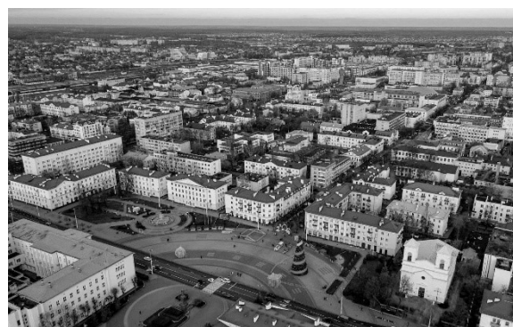
Рис. 8. Площадь Ленина в Бресте, современное состояние [9]

Площадь Ленина с 1939 по 1941 гг. называлась 17 сентября, потом Адольф Хитлер плац, затем именем В. И. Ленина. Окончательное решение приобрела в 1958 г., после установки памятника Ленину. Площадь получила большое свободное пространство, окаймленное общественными административными зданиями, расчленена на части городской магистрали с сильным транспортным движением, небольшими озелененными участками и фонтаном. Уникальность размещения площади в том, что к ней примыкает сквер Э. Ожешко, что благоприятно сказывается на микроклимате площади.