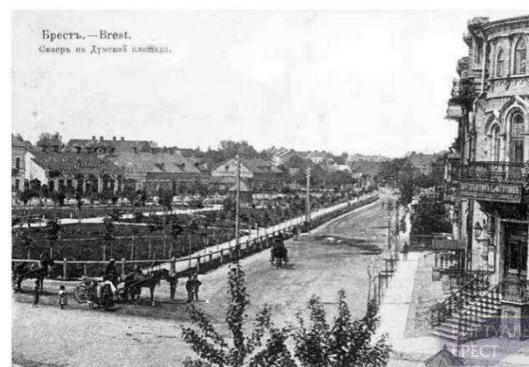
Рис. 6. Сквер на Думской площади [7]

В XIX в. при создании нового города на стыке двух элементов планировочной структуры возникла Думская площадь (рис. 6). Пространство формировалось двухэтажными зданиями городской думы, городской управы, ратуши, библиотеки и другие административными зданиями. Отличительной особенностью этой площади является сквер, разбитый посередине площади, что не было характерно для небольших городов того периода, но свойственно площадям российских городов.