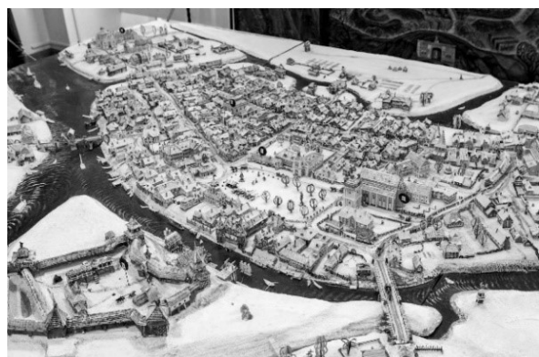
Рис. 2. Макет средневекового Бреста [3]

ства Пресвятой Богородицы с двумя храмами и др.) [2, с. 55]. Главным общественным пространством являлся рынок, оформленный общественными зданиями, и выполняющий также роль административной, культовой площади (рис. 2).