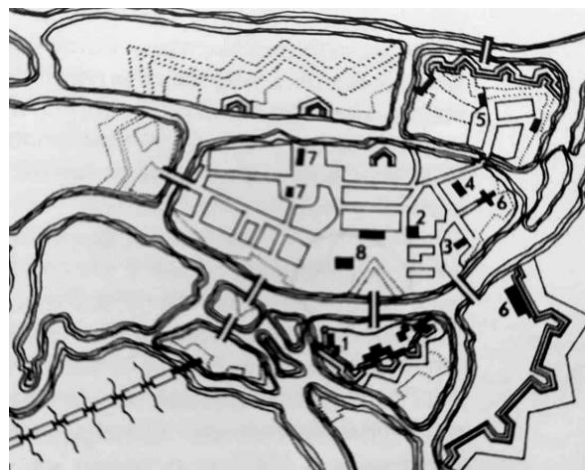
Рис. 1. План Бреста 1657 г.: 1 – замок; 2 – костел иезуитов; 3 – фарный костел; 4 – православная церковь; 5 – костел доминиканцев; 6 – бернардинские монастыри; 7 – синагоги; 8 – рынок [2, с. 59]

К XVI в. произошел прирост населения, рост территории города, развитие его планировочной структуры, возникли новые значимые общественные и культовые объекты (приходской костел, синагога, кальвинский сбор, типография, гостиный двор) (рис. 1). В этот период в городе было много храмов (Спасо-Преображенская церковь, Симоновский монастырь, обитель Рожде-