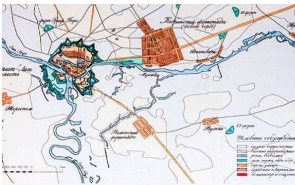
Рис. 5. Карта Бреста в середине XIX в. [3]

В 1833 г. параллельно начали стали строить новый город Брест-Литовск в 2-х км восточнее крепости. Новый город создавался как многие уездные города Российской империи (рис. 5).