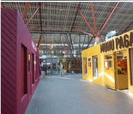
Рис. 2. Интерьеры Балтийского рынка в Таллине

В территорию рынка для его рационального функционирования традиционно включаются открытые и закрытые пространства: