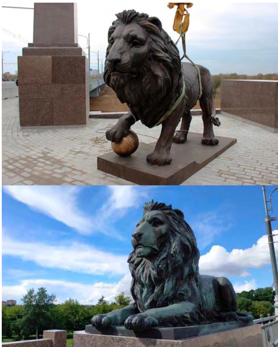
Рисунок 2 – Бронзовые статуи львов в Могилёве

В наше время перила модернизированного сооружения украшают 118 медальонов с гербом Могилёва. Также людей встречают и провожают творения могилёвского скульптора Андрея Воробьёва - бронзовые статуи львов. Две фигуры изображают зверей, стоящих на лапах и опирающихся на шар, а две других представлены в лежачем положении (Рис. 2).