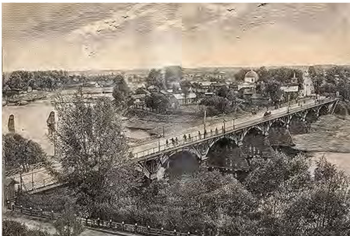
Рисунок 1 – Пушкинский мост в годы ВОВ

Трудно представить, что раньше пролётные строения и опоры мостов были полностью деревянные. Именно такой мост начал впервые эксплуатироваться в 1860 году. Сооружение было построено по международным стандартам, и в дальнейшем получило имя Александра I – российского императора. Из-за территориальных особенностей размеры моста были такие: высота – более 12 м., длина – около 192 м. Позже движение пароходов из-за узких пролётов между опорами стало затруднительным, поэтому в 1902 году была проведена реконструкция. Этот мост множество раз ремонтировали и отстраивали вновь, из-за взрывов его в годы Великой Отечественной Войны (Рис. 1).