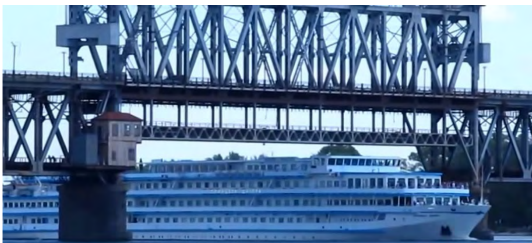
Рисунок 2 – Приподнятый центральный пролет моста