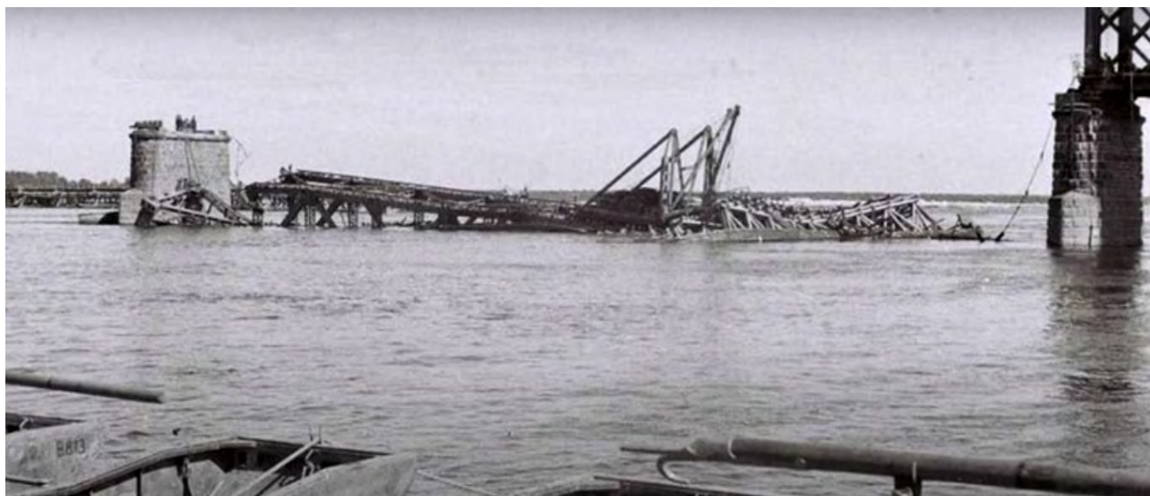
Рисунок 4 – Фотографии разрушенных пролетов моста

Во время Второй мировой войны мост был частично разрушен (Рис. 4). Восемь пролетов остались целыми, однако было принято решение разобрать все и оставить только каменные опоры, на них возвели уже новый, двухъярусный мост.