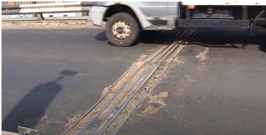
Рисунок 5 – Дефекты асфальтного покрытия

Общая длина моста составляет 1200 метров. Всего действует 4 полосы для движения автотранспорта и 2 пути для поездов. За сутки по мосту проезжает до 3000 грузовых автомобилей что очень сказывается на состоянии асфальтного покрытия (Рис. 5)