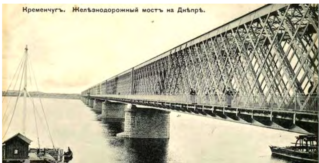
Рисунок 1 – Фотография моста 1892 года

Почти 70 лет правые и левые берега Днепра соединяет уникальный мост. Его особенность не только в 2 ярусах. Посередине, так же, есть пролет (Рис. 2) который вертикально поднимается вверх, если необходимо пропустить какое-нибудь судно. Крюковский мост, как его называют сегодня, обеспечивает проезд автомобилей и поездов. Изначально эта переправа была только железнодорожная (Рис. 1).