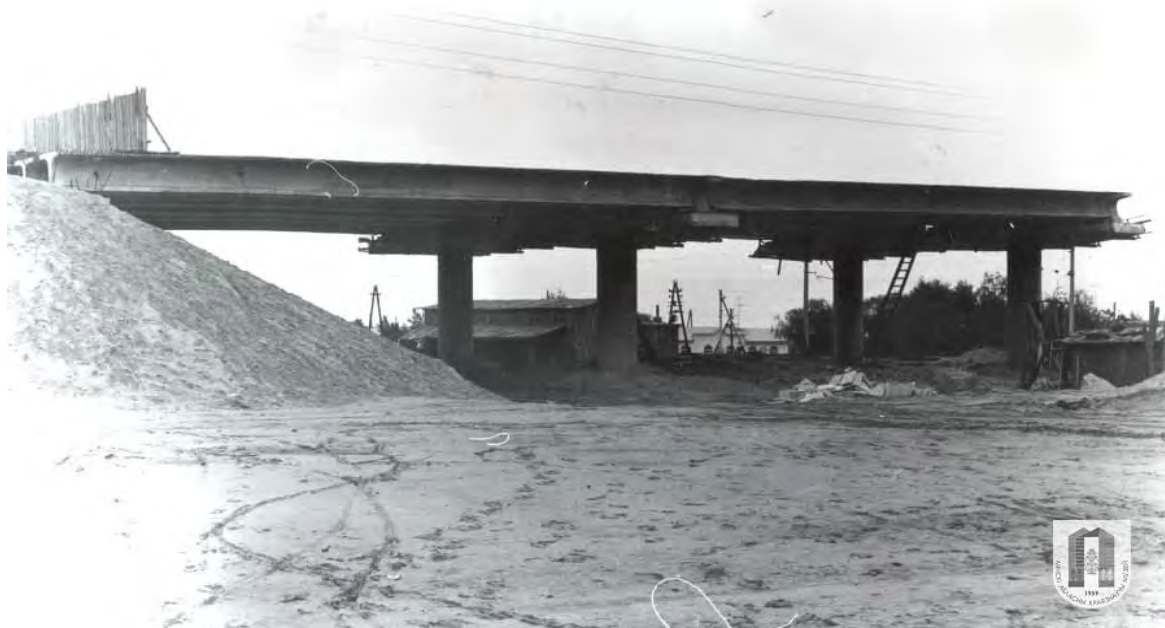
Рисунок 2 – Строительство Молодечненского путепровода 1976 г

Строительство данного путепровода стало целой историей. Постоянно проводились планерки, выпускались газеты-молния, рассказывающие о буднях стройки.