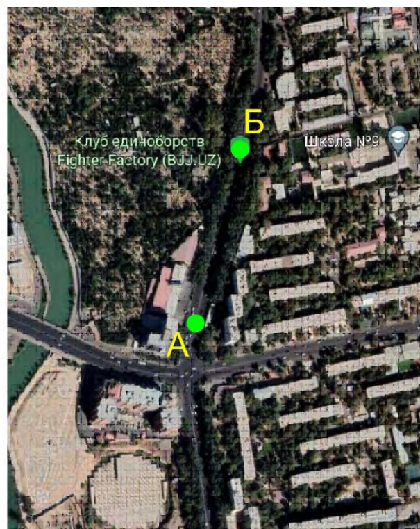
Рисунок 2 – Генеральный план