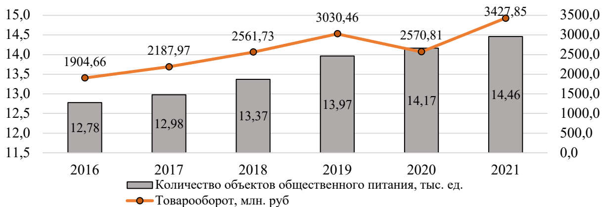
Рисунок 1 – Развитие объектов общественного питания в Республике Беларусь в 2016–2021 гг.

Анализ развития сферы общественного питания в Республике Беларусь показывает устойчивый рост количества объектов общественного питания и товарооборота (рис. 1) [1]. Снижение товарооборота в 2020 году обусловлено неблагоприятным воздействием и ограничениями, вызванными пандемией COVID-19.