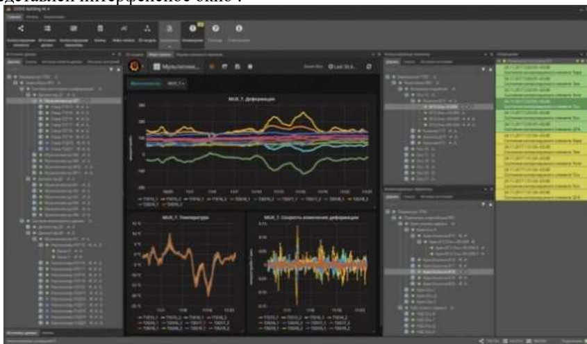
Рисунок 3.Интерфейс программа SODIS Building M

Обмен данными между пользователями и цифровой моделью, двойником происходит в специализированных программах. Такое программное обеспечение было сделано компаниями Siemens, Aveva, Tango, Altec Systems, EPLAN Software & Service Russia, СОДИС Лаб (РФ), на рисунке 3 представлен интерфейсное окно .