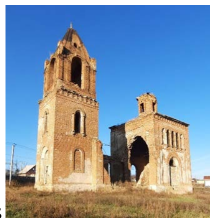
Рис. 2. Церкви: А – Сурб Карапет в с. Несветай; Б – Сурб Геворг в с. Султан-Салы

Сурб Геворг в с. Султан-Салы (Рис. 2 Б) построена в «русско-византийском» стиле, что отличает ее от остальных храмов донских армян. В предыдущем исследовании было показано, что в основу проекта церкви были положены образцовые проекты К. Тона [7], изданные в 1838 г. Объемно-планировочное решение церкви трехчастное — четверик, трапезная и колокольня. Четверик церкви завершает парусный свод с луковичным куполом на небольшом световом барабане. Квадратная в плане трёхъярусная колокольня церкви над ярусом звона завершалась шатром с луковичной главкой. Мотив перспективного оформления порталов