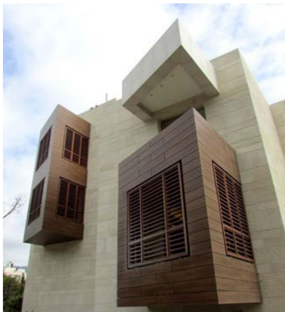
Рис. 3. Машрабия в современной интерпретации. Жилой дом в г. Вавлия

Машрабия в контексте реальной жизни современного общества в соответствии с технологическими возможностями, культурными и поведенческими аспектами в различных климатических зонах арабского мира, в жилых и общественных зданиях, в городах и сельских поселениях рассматривалась в научных исследованиях Maria Luisa Germanà, Bader Alatawneh, Rabee M. Reffat [2]. Результаты данного исследования представляет интерес в контексте сохранения традиционных элементов ливанской архитектуры в современной интерпретации с учетом идентичности, новых технологий и материалов. На рис. 3 представлен пример возрождения традиционной архитектуры в современной трактовке.