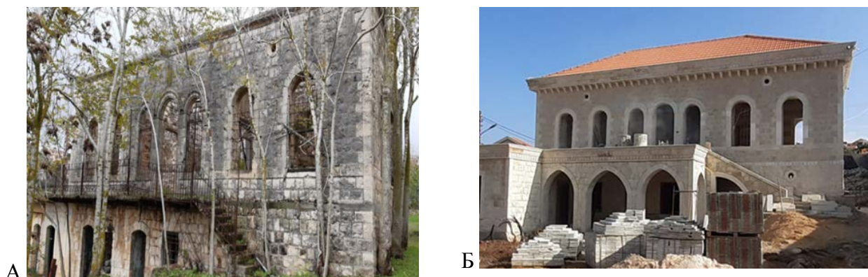
Рис. 1. Жилой дом в г.Айната. Реконструкция. Реализация 2022 г. Арх. М. Бошар:

Концепцией ливанского дома традиционно является гармония с природой и «открытость к внешнему миру» через окна (от простых квадратных и прямоугольных до мандалунов – двухарочных окон), арки, аркады, галереи. Тройная арка как элемент традиционной ливанской архитектуры, давший название исключительно ливанскому типу дома – «дом с тройной аркой», который появился в середине 19 в. и редко встречается в соседних странах. Этот тип дома является национальным достоянием ливанской архитектуры и как дань уважения традиции бережно сохраняется ливанскими архитекторами по согласованию с заказчиками в процессе реконструкции (рис.1).