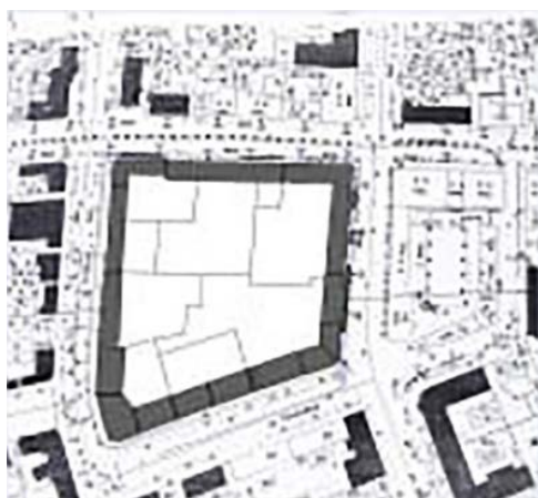
Рис.1. Планировочная схема квартала по состоянию до начала 70-х гг. XX в.

Перед Самаркандом как перед всемирно известным историческим центром, а также центром международного туризма, стоит задача усиления его экспозиционной привлекательности. Основные международные туристические маршруты по городу охватывают его исторически сложившуюся традиционную часть (исторический город, основанный Амиром Тимуром, известным как «Тамерлан»). Также центром интенсивного международного туристического посещения является и исторически сложившаяся европейская часть. Эта часть города сложилась, начиная с середины 19 – начала 20 вв. (в связи с присоединением территории Средней Азии к России).