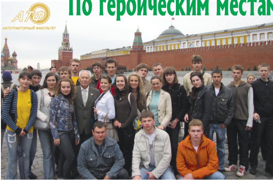
Участники автопробега АТФ на Красной площади в Москве