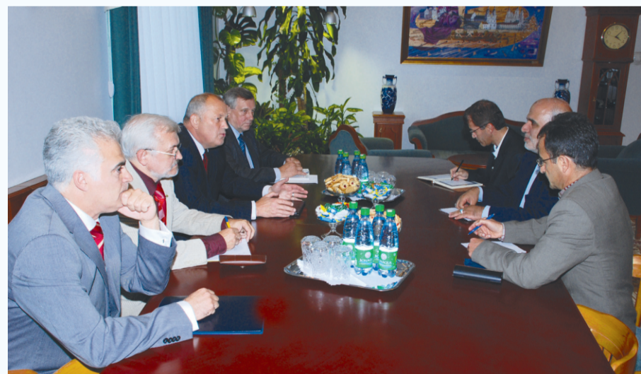
Договоренность о подписании Соглашений о сотрудничестве с двумя ведущими техническими вузами Исламской Республики Иран достигнута.

рым именем. Поэтому возрождая спортивные традиции Политеха, ректорат БНТУ во главе с членом исполкома Национального олимпийского