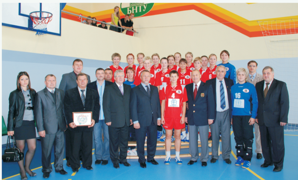
Руководство Белорусской федерации гандбола, Национального олимпийского комитета Беларуси, министерства спорта и туризма страны, представители ректората БНТУ с гандбольной командой «БНТУ-БелАЗ»

«Рэспубліка» 24.09.2009