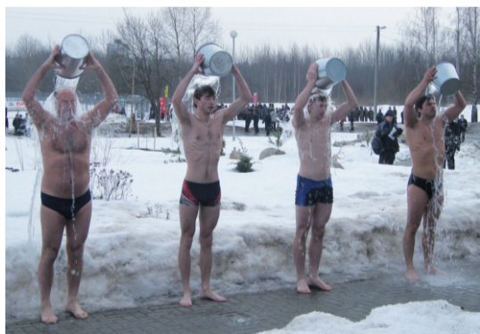
Лучшее средство против гриппа и ОРЗ