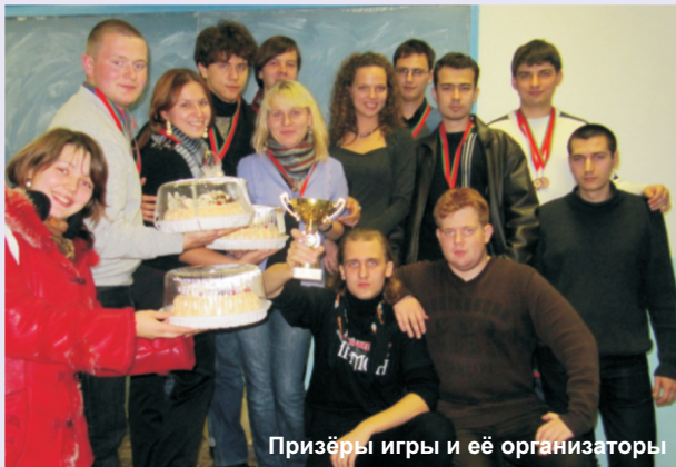
Призёры игры и её организаторы

Тем вечером большинство студентов нашего университета, перепрыгивая через мокрые следы, оставленные прохожими на дорожках БНТУ, спешили домой. А студенты ЭФ, безусловно не все, а лишь те, кому не даёт покоя игра «Брейн-ринг», собрались в очередной раз, чтобы выявить тройку лучших команд факультета.