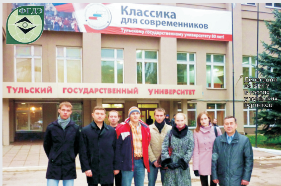
Делегация из БНТУ в гостях у тульских горняков

Студенческая жизнь для нас, старшекурсников ФГДЭ, это не только повседневные учебные занятия: лекции, лабораторные, курсовые проекты по спецдисциплинам. Все гораздо интереснее и многообразнее – культурно-массовые и спортивные мероприятия в общегитии, встречи с ведущими специалистами-горняками во время производственных экскурсий на профильные предприятия: ОАО «Беларуськалий», РУП «Беларуснефть» и «Белгеология». Особо хотелось бы отметить возможность приобщиться к научно-исследовательской работе в студенческом научно-творческом бюро «Горняк». Именно здесь, в коллективе друзей под руководством опытных руководителей, можно проверить и узнать начальный научный потенциал каждого из нас, так необходимый перед распределением и выбором своего дальнейшего пути: трудовой деятельности на производстве или поступления в магистратуру и аспирантуру.