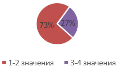
Рис. 2. Количество значений терминов

Таким образом, в результате анализа текстов по неоклассической архитектуре кампусов Оксфордского университета были установлены основные характеристики терминологических единиц, используемых для описания кампусов Оксфордского университета. Большинство терминов имеют французское происхождение (40 %). Все термины однословные. Для большей части терминов (73 %) характерно наличие 1–2 значений и только для (27 %) – два-три значения.